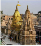
विश्वनाथ मन्दिर वाराणसी

गोरखपुर शहर उड़ान सेवाओं, सड़क मार्गों और रेल से अच्छी तरह जुड़ा हुआ है। गोरखपुर शहर विभिन्न प्राचीन एवं ऐतिहासिक स्थलों से भी घिरा हुआ है।